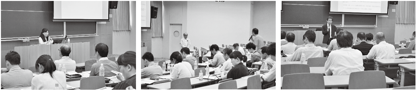
公開講習会の様子