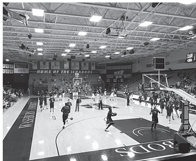
ウォッシュバン大学（アメリカ、カンザス州トピカ市）