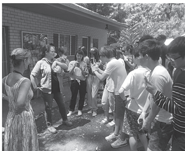
サザンクロス大学 （オーストラリア、ニューサウスウェールズ州リズモア市）

学では英語の勉強のほかに、自然豊かな環境やホームステイ先の家族との温かい交流を楽しめる。中国語学習者には上海立信会計金融学院で2週間、韓国語学習者にはソウルの漢陽大学校で3週間の語学研修がある。