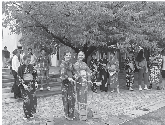
2017CUC サマープログラム 浴衣打ち水体験