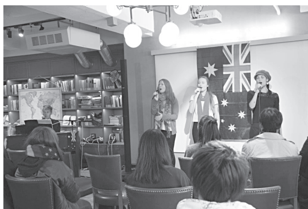
CUC International Square サザンクロス大学イザベラ・アカペラ公演