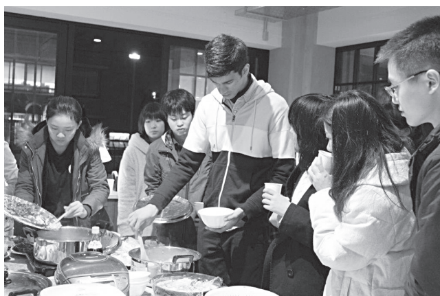
国際寮 クッキングフェスの準備

以上、千葉商科大学における国際化の試みの一端を紹介した。実際に海外を体験した学生、国際交流に関わった学生は、全学生6000人のなかではまだまだ少数派なので、この数を増やしていくのが私たちの課題だと思っている。グローバル化する世界の中で日本の将来を担っていく若者たちをこれからも全力で応援していきたい。