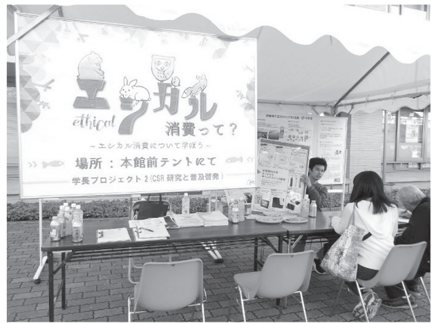
瑞穂祭のブースで「エシカル消費」を説明する千葉商大生

11月に開催された学園祭「瑞穂祭」で、エシカル消費を啓蒙するブースを出展し、併せてアンケートによる実態調査を行った。195名分のアンケート集計では、「エシカル消費」という言葉を「聞いたことがある」割合は3割弱である反面、「必要なことである」と答えたのは8割以上であった。すなわち、エシカル消費という言葉は知らないものの、概念は共感するということである。われわれはこうした認知のエシカル消費を大学教育に取り組むのである。エシカル消費が意味解説と共通認識醸成に始まり、学生一人ひとりが実践するとどのようによりよい社会実現に寄与するのか繰り返し説き、それを具体的な消費活動に結びつけるという教育である。そうした教育は類例がなく多くの困難も予想されるが、大学教育に関わる者の矜持として、これを強力に推し進める決意である。