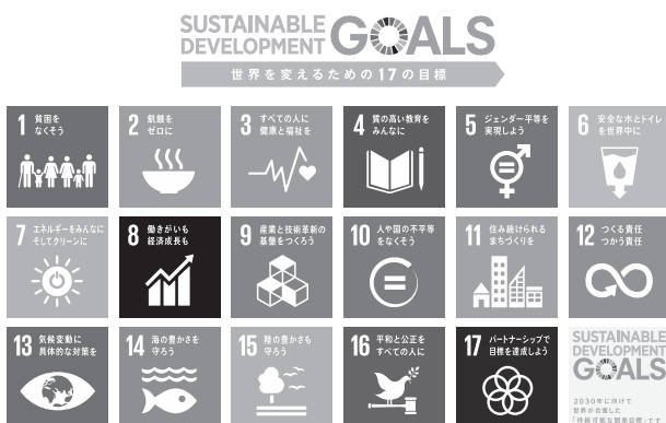
図1 Sustainable Development Goals: SDGs