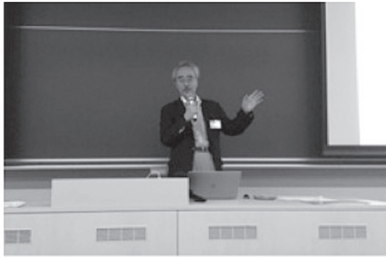
日本計画行政学会での原科学長の発表 2017/9/9

第1部「環境社会問題って何だろう」第2部「環境社会問題を解決する学問の取り組み」第3部「政府や大学、企業・市民の取り組み」に分け、学長プロジェクト2及び4に関わる教員を中心に、外部有識者や企業・環境省の協力を得て講義を行う予定である。全学の学生が受講可能で、2018年度は商経学部・政策情報学部・サービス創造学部の学生は単位取得可能となっている。