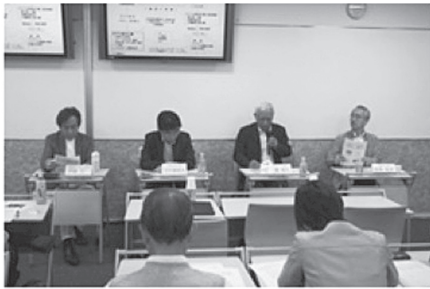
CUC 公開講座の様子 2017/9/30