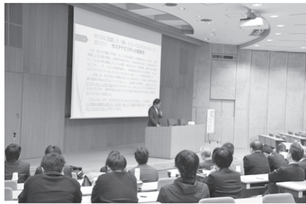
第三回学長プロジェクト・フォーラム 2017/11/22

上昇と入学者の多様化は大学に教育・研究面の改革を迫り、産業界における雇用形態の多様化は卒業生の質の保証を求めるようになってきている。エネルギー問題・環境問題・少子高齢化問題などの社会的課題により、大学に対する期待や要望も変化している。こうした中、大学は従来にも増してステークホルダーとのコミュニケーションを深めてニーズを見極め 1 、意味ある応答を通して適切に対応することが重要な課題となっている。