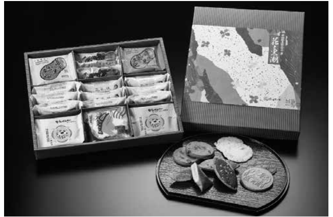
多彩な銘菓の組み合わせ

き三彩」「牛乳せんべい」「甘藷の里」「実りのパイ」「おれんじ芋タルト」「南総里見八犬伝」などの当社を代表する商品においても、様々な賞をいただきました。現在の店舗展開は、本社・直営店の6か所となっております。卸売り販売先は、大手総合スーパーマーケット、百貨店、高速道路SA・PA、各ホテル、その他を中心に約70か所となっております。