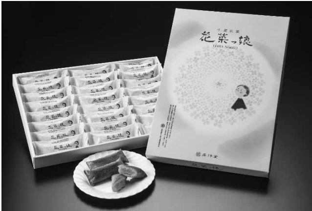
ロングセラー商品「花菜っ娘」

「花菜っ娘」は、油脂をたっぷり含んでいますが、ホイール焼きのため型崩れが無く、ふっくらとして、かつしつとりとした食感の商品となりました。発売数年後、アルミホイールでくるむ機械が出回りました。また、ネーミングについてもこだわりました。菜の花は、南房総の地元では「菜花」や「花菜」と呼ばれていました。「花菜っ娘」は、早春の菜の花畑にたたずむ幼い娘をイメージしました。